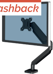
Ramię na 1 monitor Platinum