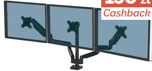
Ramię na 3 monitory Platinum