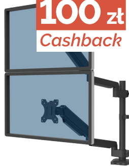
Ramię na 2 monitory pionowe Platinum