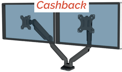
Ramię na 2 monitory Platinum